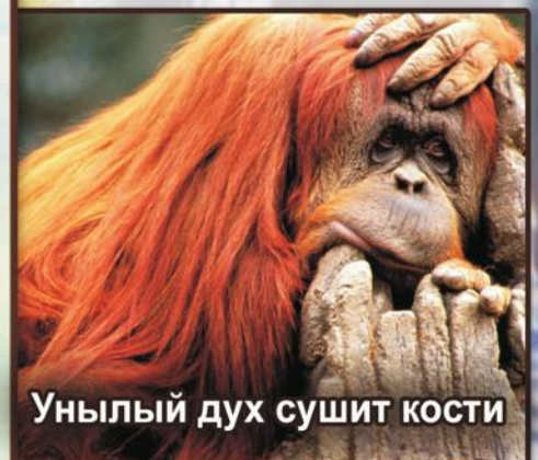
Унылый дух сушит кости