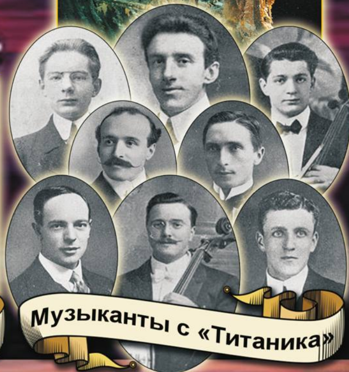
Музыканты с «Титаника»

“Титаник”... Кажется, само название было дано ему неспроста. Согласно древнегреческим мифам, титаны восстали против богов, но были побеждены и за свою гордыню низвергнуты с небес в преисподнюю...”